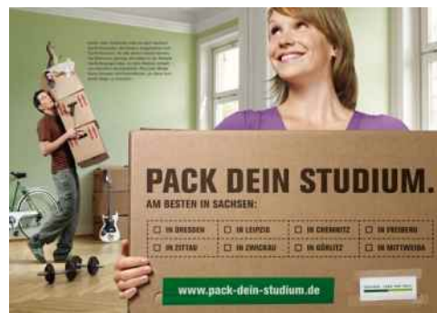
Plakatmotiv der Kampagne „PACK DEIN STUDIUM“

Die im September 2008 von Sachsens Staatsministerin für Wissenschaft und Kunst, Eva-Maria Stange, gemeinsam mit dem VSW-Präsidenten Bodo Finger gestartete Imagekampagne „Pack dein Studium. Am besten in Sachsen“ (siehe VSW-News 04/08) zeigt Wirkung. Acht Prozent der im Oktober 2008 Immatrikulierten wurden durch die Werbebotschaft auf die guten Studienmöglichkeiten im Freistaat aufmerksam, so eine Befragung der TU Chemnitz unter 2.154 Erstsemestern aller sächsischen Hochschulen. Vor allem in Westdeutschland stößt die Kampagne auf positive Resonanz. Über zehn Prozent der Studienanfänger aus den alten Bundesländern konnten auf diese Weise nach Sachsen geholt werden. Die VSW sieht sich durch das Ergebnis bestärkt und wird ihre Unterstützung für die Kampagne fortsetzen.