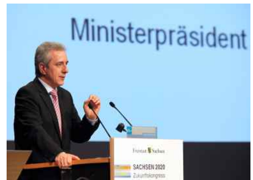
Stanislaw Tillich stellt sein Grundsatzpapier vor

Die VSW als Spitzenverband der sächsischen Wirtschaft sieht in der Globalisierung eine große Chance für den Freistaat. Weltweite Märkte bieten für die Unternehmen in Sachsen den einzigen Ausweg aus der Krise. Leistungsstarke, produktive Anlagen stellen in etablierten Industrieregionen wie auch in Entwicklungsländern gleichermaßen die Voraussetzung für Wachstum und Wohlstand dar. Die sächsische Wirtschaft hat mit ihrem Know-how und ihrer Wettbewerbsfähigkeit beste Voraussetzungen, derartige Maschinen und Anlagen in höchster Qualität zu produzieren. Deshalb muss die Exportstärke der Industrie im Freistaat weiter ausgebaut werden.